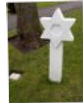
Etoile de David pour les soldats juifs

Devant cette chapelle se tient un grand mat où flotte le drapeau américain descendu chaque soir et plié en triangle de façon à cacher les rayures rouges (=sang). Donald Trump est venu le 11 XI 2018 pour le centenaire de l'armistice.