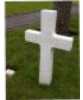
Croix romaine Pour les soldats de toute autre religion